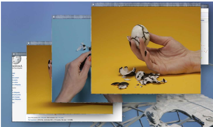
Camille Henrot Grosse Fatigue, 2013 Vidéo, 13 min Avec le soutien du Fonds de dotation Famille Moulin, Paris; Groupe Galeries Lafayette; Institut Français; kamel mennour, Paris