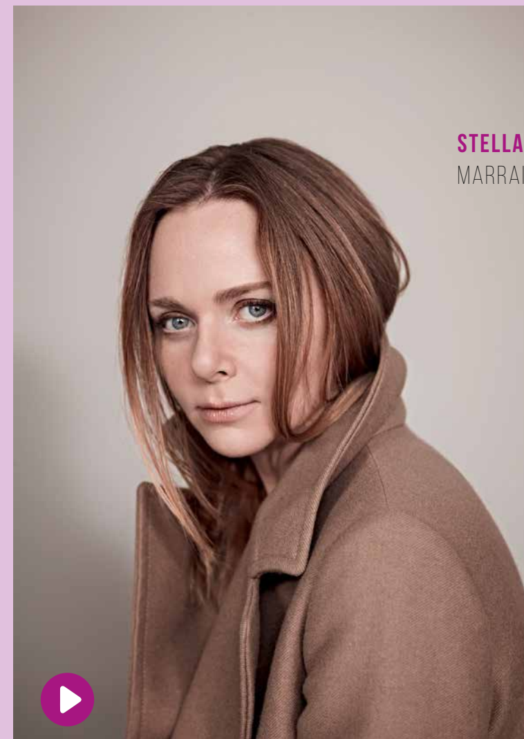
STELLA McCARTNEY, MARRAINE ENGAGÉE DE GO FOR GOOD

Ce mouvement prend vie à travers une première manifestation d'envergure qui se déroule du 29 août au 10 octobre 2018, parrainée par Stella McCartney, créatrice engagée et ambassadrice de la mode responsable à travers le monde.