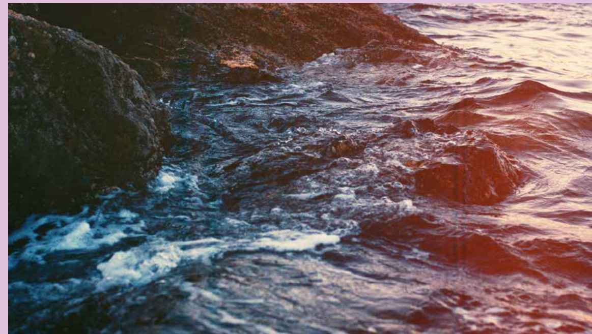
Image extraite du film Curtains Up , raconté par David Lynch. Réalisé par Tête-à-Tête, studio de création basé à Los Angeles et fondé par le cinéaste Austin Lynch et l'artiste Case Simmons.